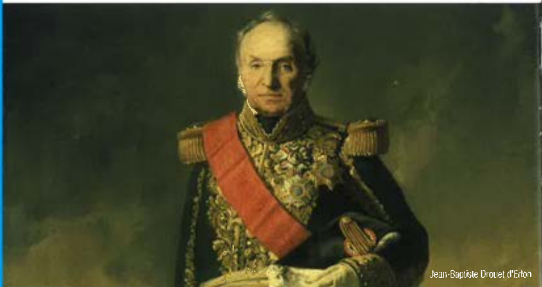
Jean-Baptiste Drouet d'Erlon

Ces deux hommes célèbres ont donné leur nom à deux rues de notre village.