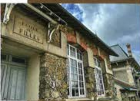
L'école Jules Ferry n'accueille plus d'élèves